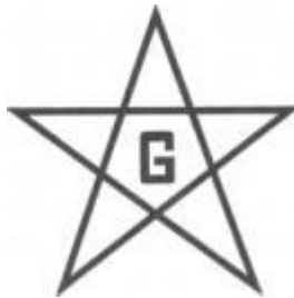
BEŞ KÖŞELİ YILDIZ